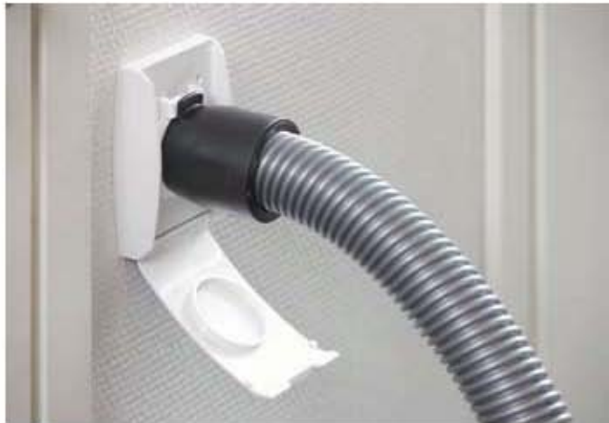
Imurin letku työnnetään imurasiaan ja imurointi voi alkaa.

Puzer Oiva-keskuspölynimurin poistoilma ja sen mukana myös mikropöly johdetaan poistoilmaputkea pitkin suoraan ulos. Keskuspölynimuri ei siten vain poista likaa ja pölyä, vaan myös puhdistaa sisäilmaa.